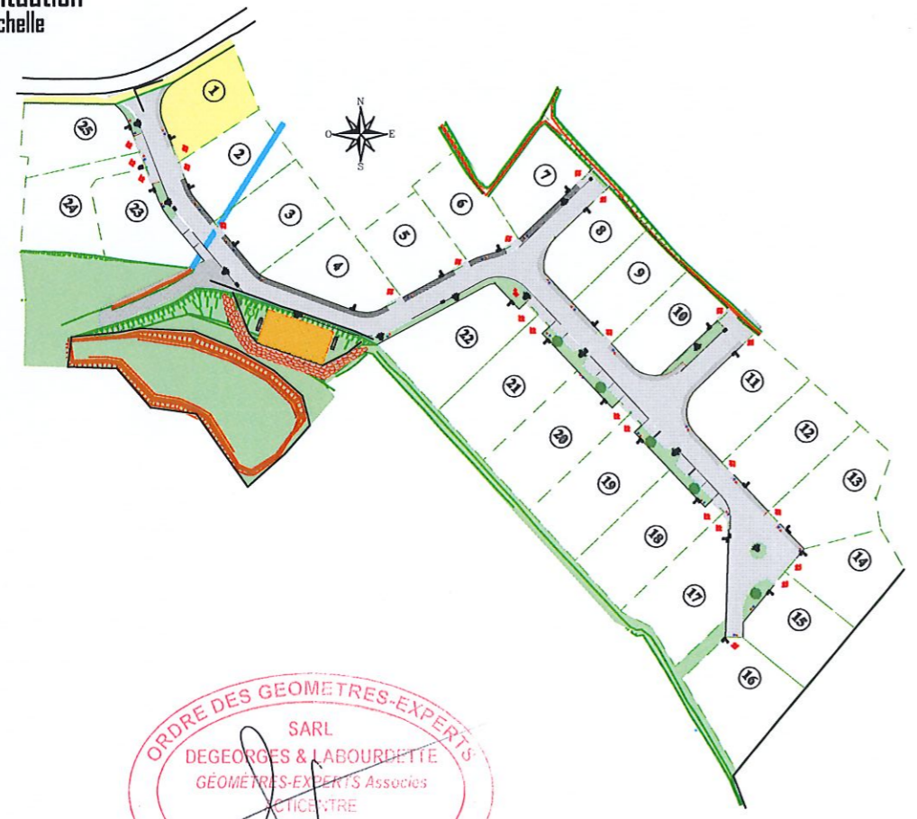
Plan de situation sans échelle

Système de référence planimétrique : Lambert 93 CC43 (Réseau GPS TERIA) Système de référence altimétrique : N.G.F. / IGN 69 (Réseau GPS TERIA)