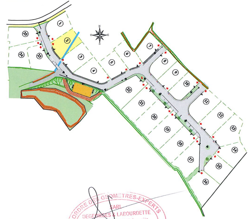
Plan de situation sans échelle

Système de référence planimétrique : Lambert 93 CC43 (Réseau GPS TERIA) Système de référence altimétrique : N.G.F. / IGN 69 (Réseau GPS TERIA)