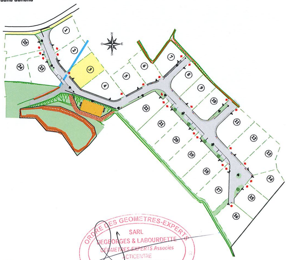
Plan de situation sans échelle

Système de référence planimétrique : Lambert 93 CC43 (Réseau GPS TERIA) Système de référence altimétrique : N.G.F. / IGN 69 (Réseau GPS TERIA)