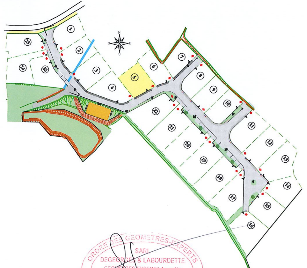
Plan de situation sans échelle

Système de référence planimétrique : Lambert 93 CC43 (Réseau GPS TERIA) Système de référence altimétrique : N.G.F. / IGN 69 (Réseau GPS TERIA)