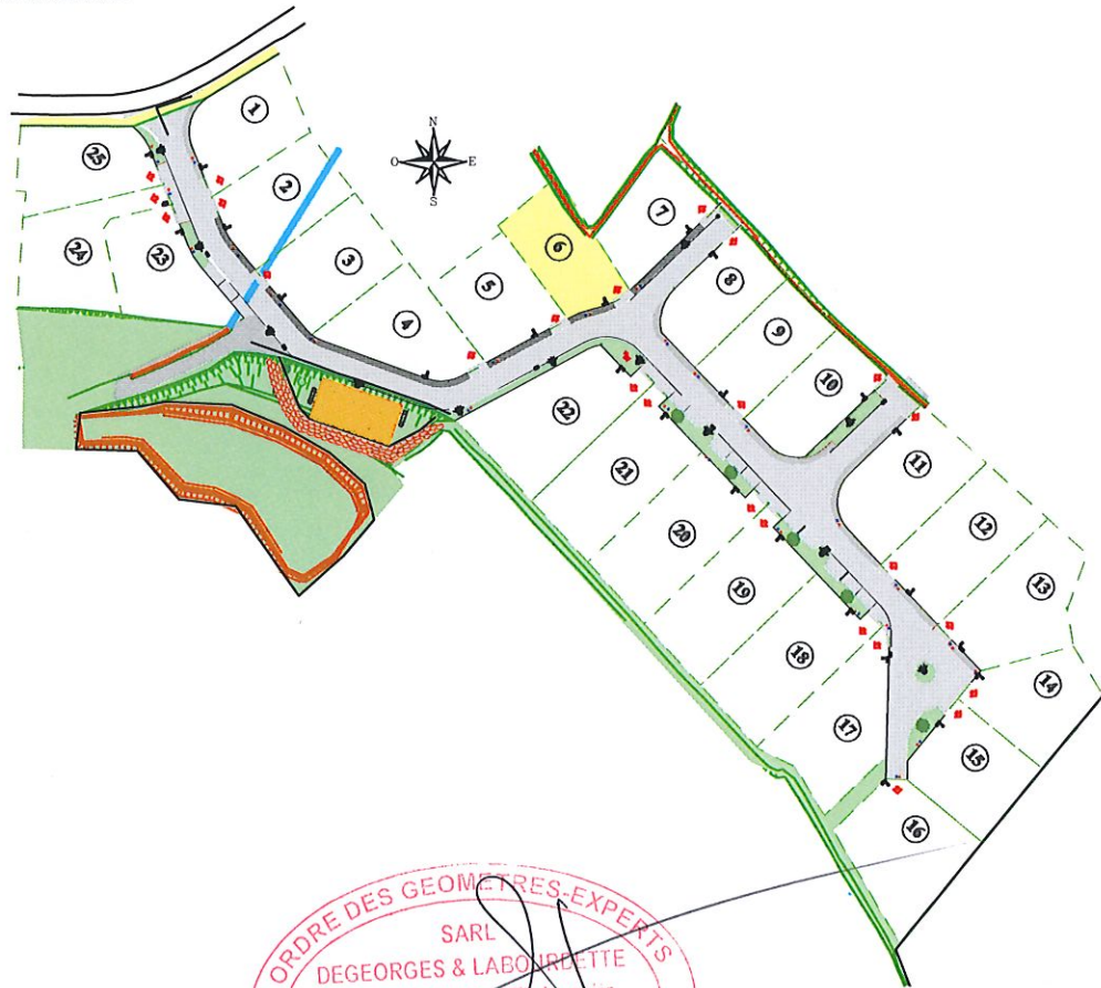
Plan de situation sans échelle

Système de référence altimétrique : N.G.F. / IGN 69 (Réseau GPS TERIA)