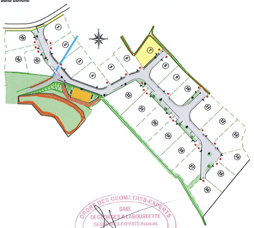
Plan de situation sans échelle

Système de référence planimétrique : Lambert 93 CC43 (Réseau GPS TERIA) Système de référence altimétrique : N.G.F. / IGN 69 (Réseau GPS TERIA)