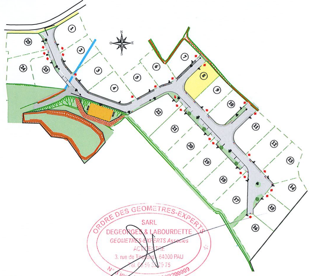
Plan de situation sans échelle

Système de référence planimétrique : Lambert 93 CC43 (Réseau GPS TERIA) Système de référence altimétrique : N.G.F. / IGN 69 (Réseau GPS TERIA)