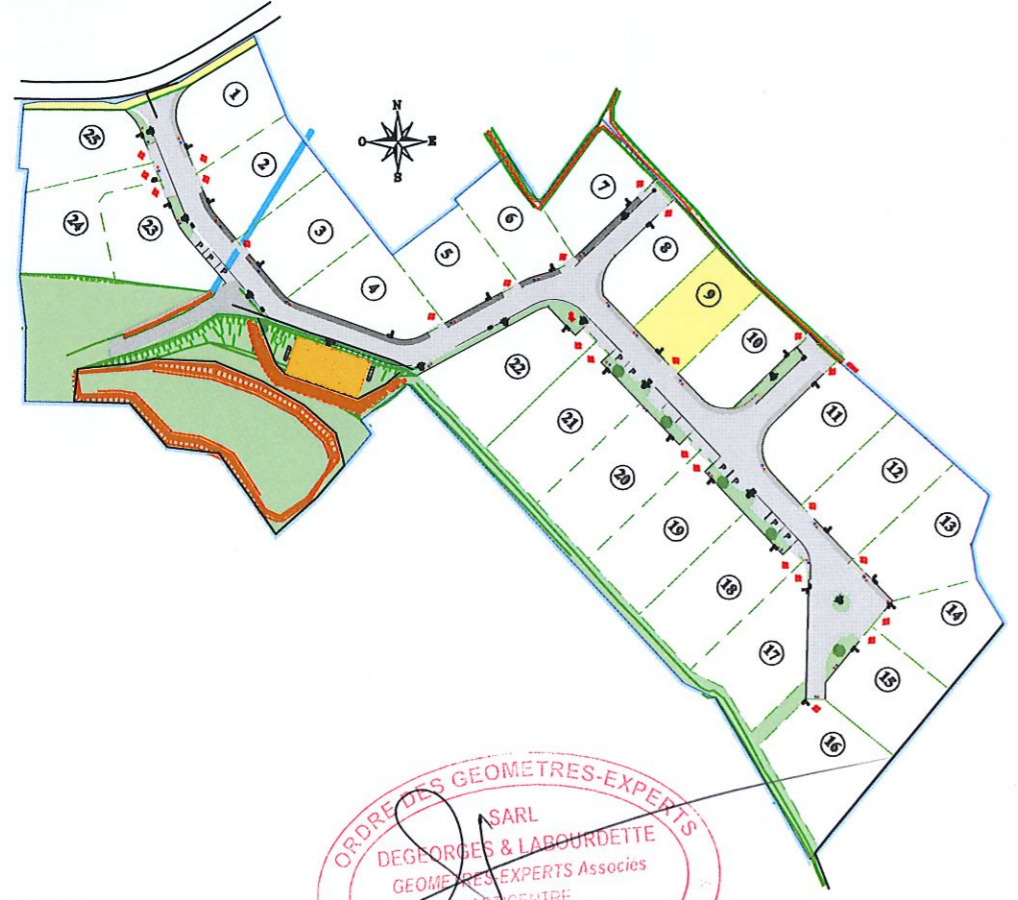
Plan de situation sans échelle

Système de référence planimétrique : Lambert 93 CC43 (Réseau GPS TERIA) Système de référence altimétrique : N.G.F. / IGN 69 (Réseau GPS TERIA)