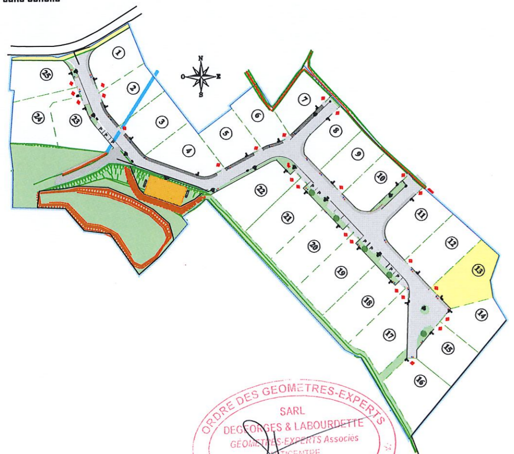
Plan de situation sans échelle

Système de référence planimétrique : Lambert 93 CC43 (Réseau GPS TERIA) Système de référence altimétrique : N.G.F. / IGN 69 (Réseau GPS TERIA)