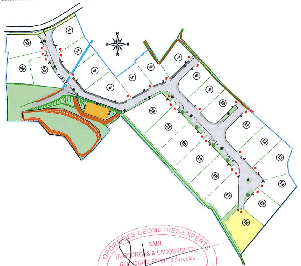
Plan de situation sans échelle

Système de référence planimétrique : Lambert 93 CC43 (Réseau GPS TERIA) Système de référence altimétrique : N.G.F. / IGN 69 (Réseau GPS TERIA)