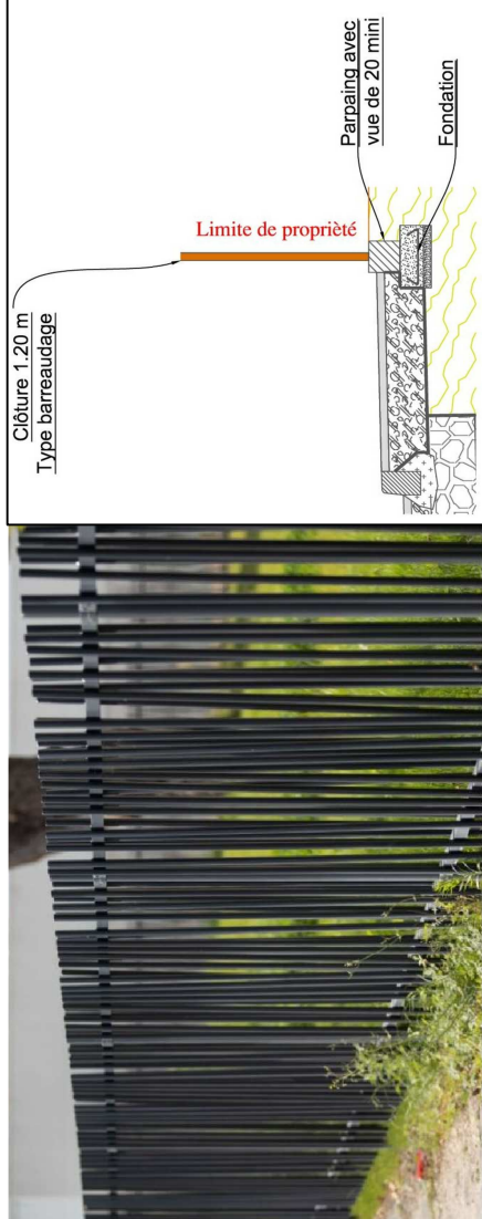
Clôture de type « barreaudage nature » de chez SBFM (photo non contractuelle)

Parties privatives ( lots de 1 à 11 ) : 5 461 m 2 Voirie : 1 171 m 2 Total à Lotir: 6 632 m 2